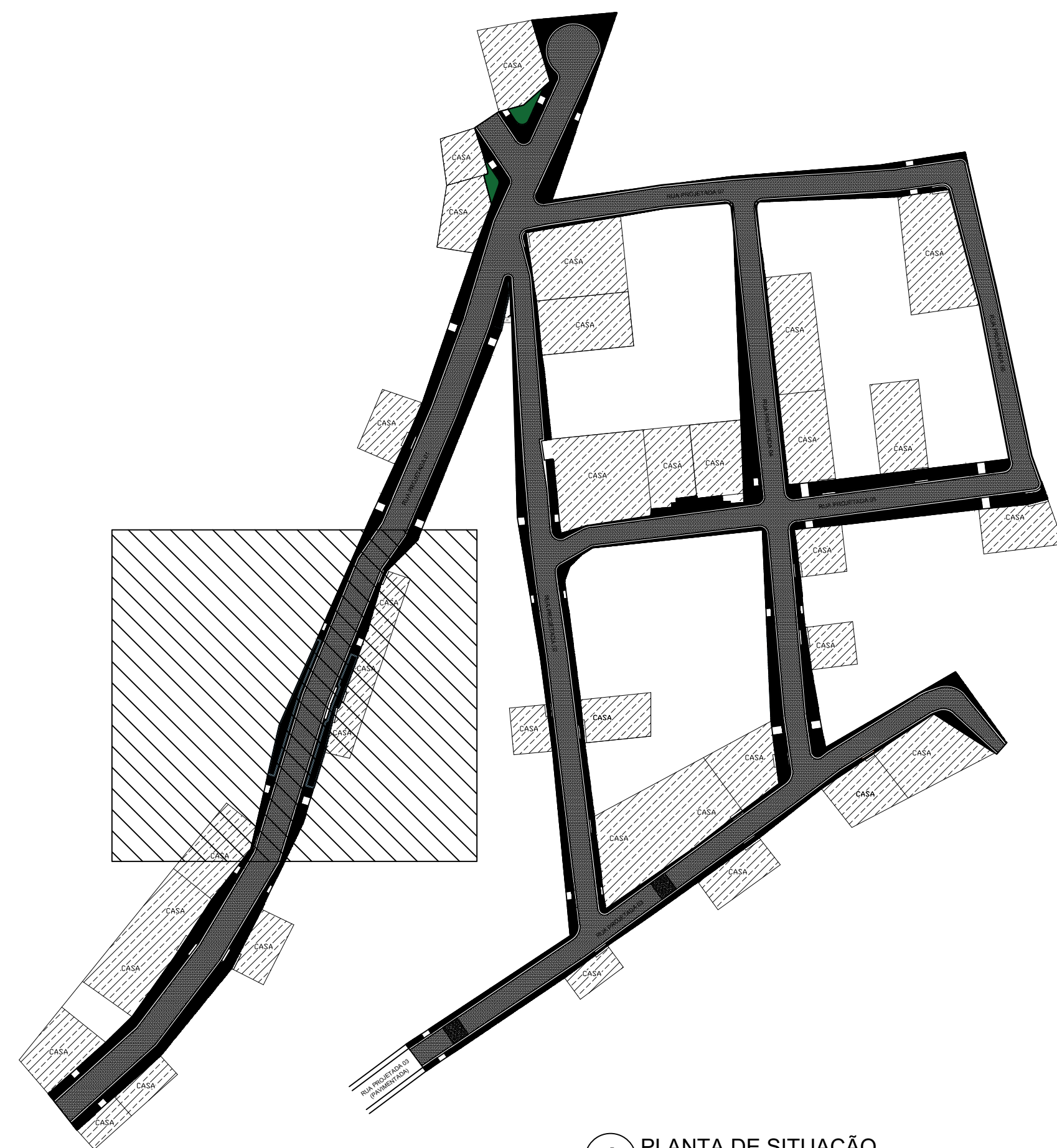
1 PLANTA DE SITUAÇÃO ESCALA 1/1000